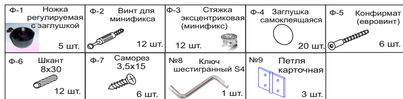
Таблица фурнитуры тумбы